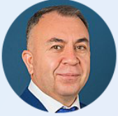
Sadiq QURBANOV Azerbaycan Meclisi Çevre Komisyonu Başkanı