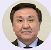
Kubanychbek OMURALIEV Kırgızistan Ankara Büyükelçisi