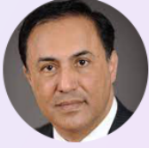
Elman NASIROV Azerbaycan Milletvekili