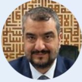
Abdullah ÇALIŞKAN Türk Dünyası Parlamenterler Vakfı Başkanı