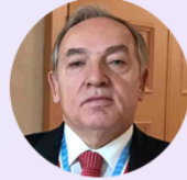
E. Büyükelçi Hulusi KILIÇ T.C. Azerbaycan Eski Büyükelçisi