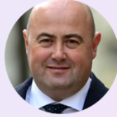
Gökhan YILDIRIM WSEIN- Dünya Sürdürülebilir Enerji Enstitüsü Başkanı